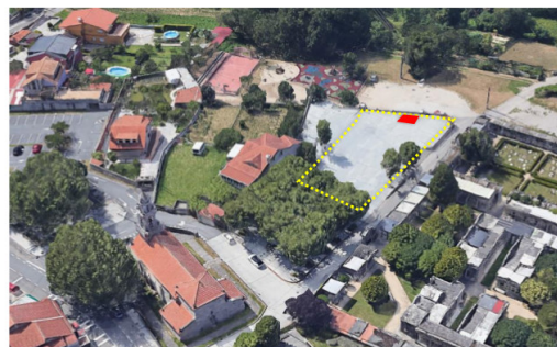
Torreiro da Festa de Beade