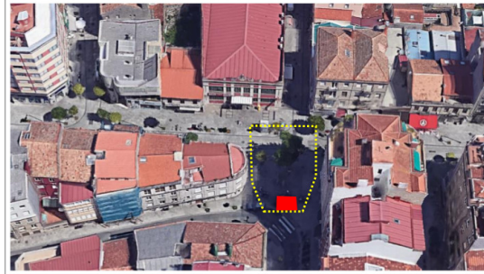
Proximidades do Mercado do Calvario