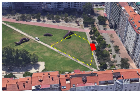
Praza da Miñoa