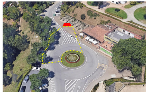
Rotonda superior do parque