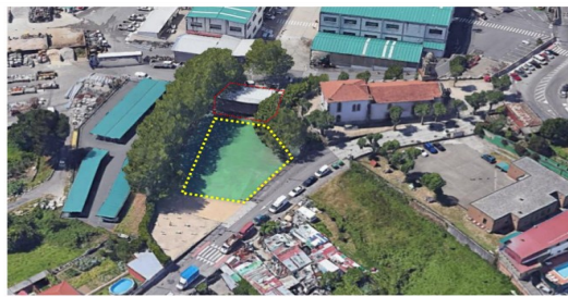
Torreiro da Festa de Santa Cristina