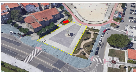
Praza da Igrexa