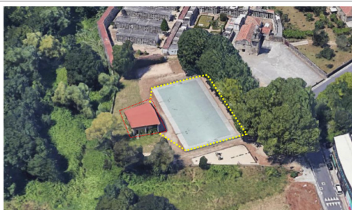
Pista deportiva e palco en Sárdoma