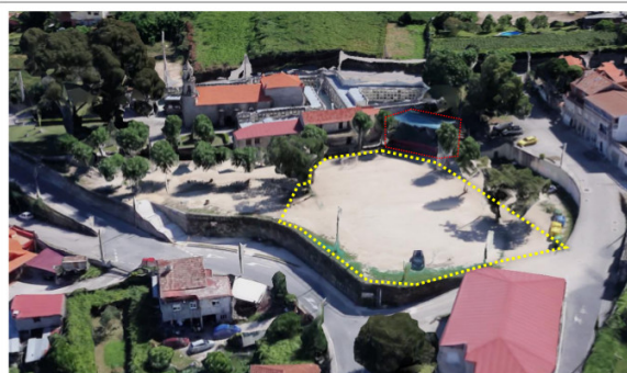
Torreiro de festa de Valladares