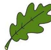
Folla de carballo